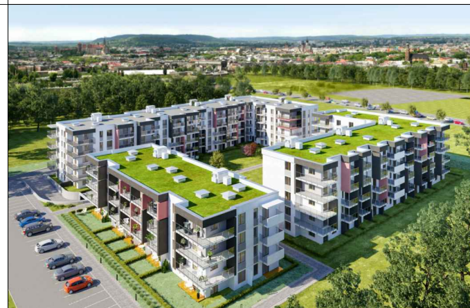
BUDYNEK A - KLATKA NR 5 - PIĘTRO III

NINIEJSZA BROSZURA NIE STANOWI OFERTY W ROZUMIENIU PRZEPISÓW KODEKSU CYWILNEGO. PRZEDSTAWIONE RZUTY MAJĄ CHARAKTER POGLĄDOWY. MIESZKANIE NIE BĘDZIE WYPOSAŻONE W WIDOCZNE NA RZUTACH ELEMENTY SANITARNE ORAZ SPRZĘT RTV I AGD.